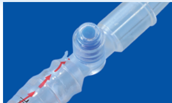
尿採取口(ニードルレスタイプ)