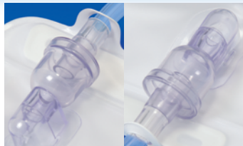
ドリップチャンバー