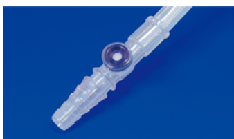
尿採取口 (ニードルレスタイプ)

針刺し切創防止対策により、尿採取口はニードルレス採尿ポートを採用しました。採尿時には、針の付いてない一般的なスリップタイプのディスプレイが使用下さい。