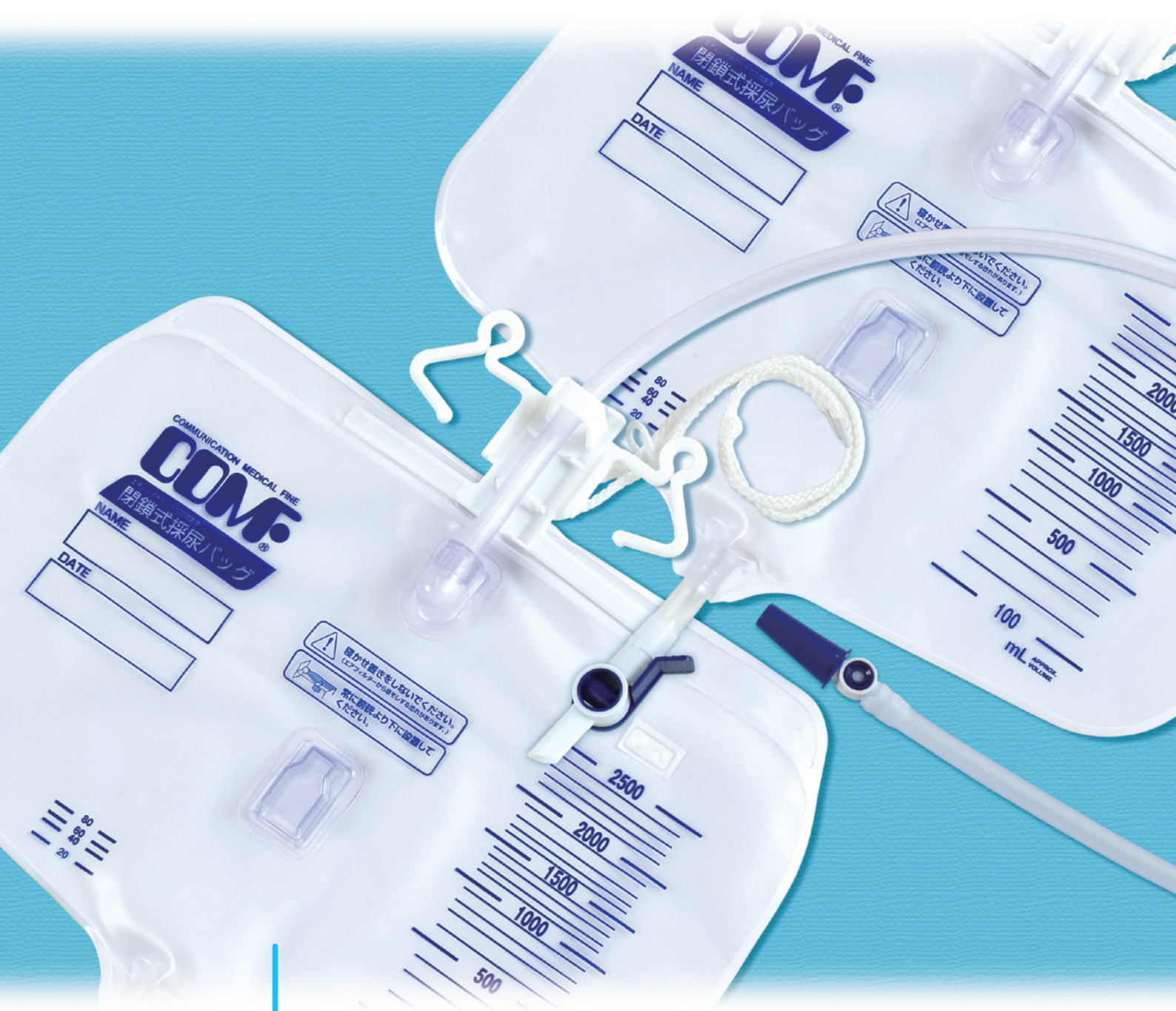
●閉鎖式採尿バッグ (スタンダードタイプ)